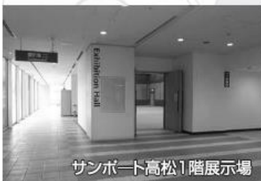
サンポート高松1階展示場